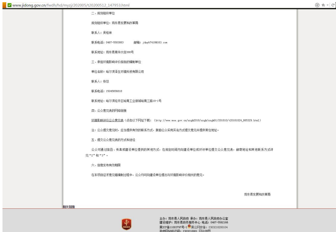
图 2-1 环评公参首次网站公示截图