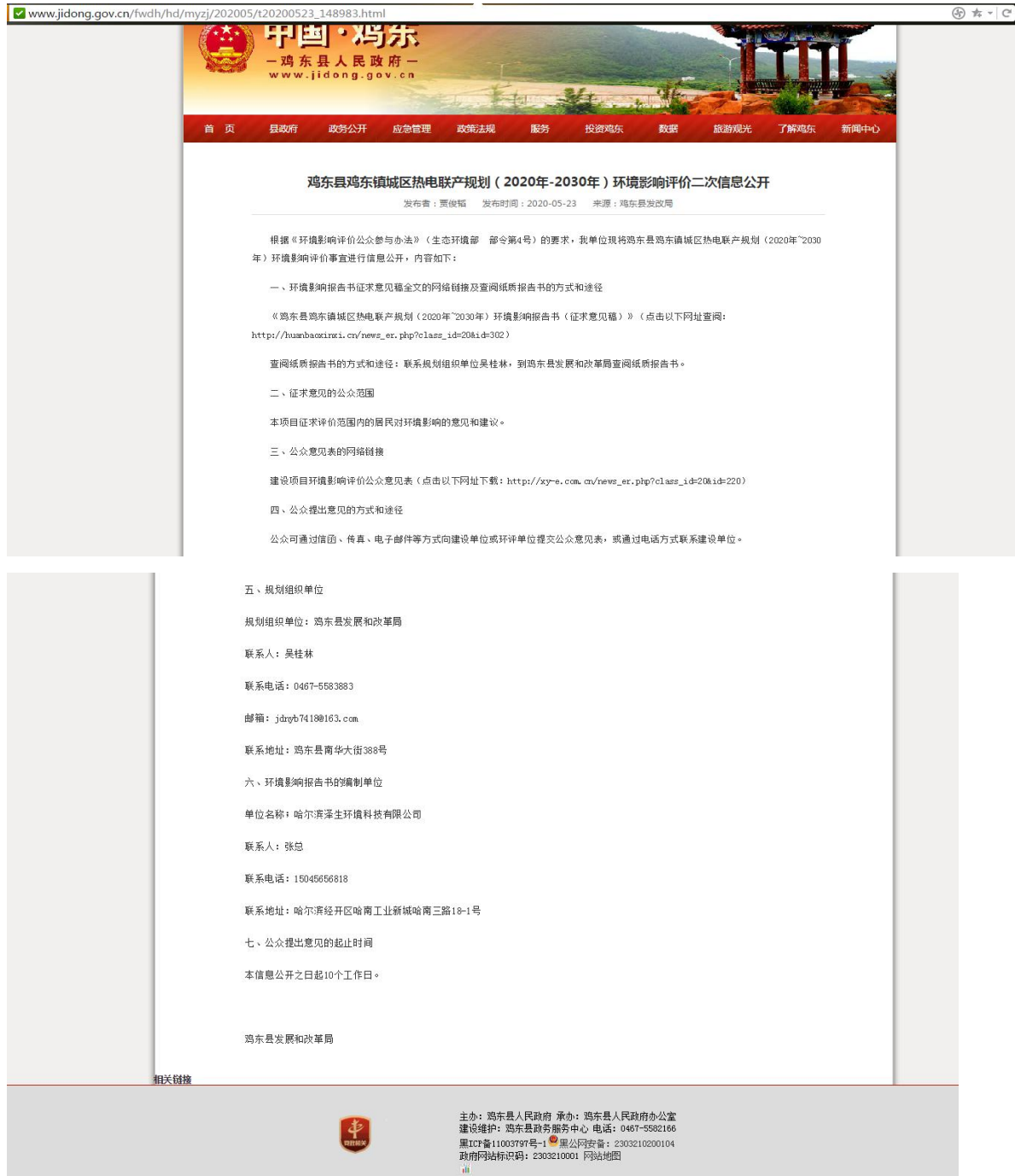
图 3-1 环评第二次网站公示截图

规划单位于2020年05月24日在鸡东县人民政府网( http://www.jidong.gov.cn/fwdh/hd/myzj/202005/t20200523_148983.html )进行第二次环境影响评价公示,并在公示期内将征求意见稿公布,公示截图见图3-1。